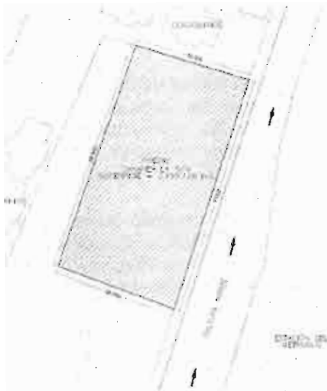
Planta del predio